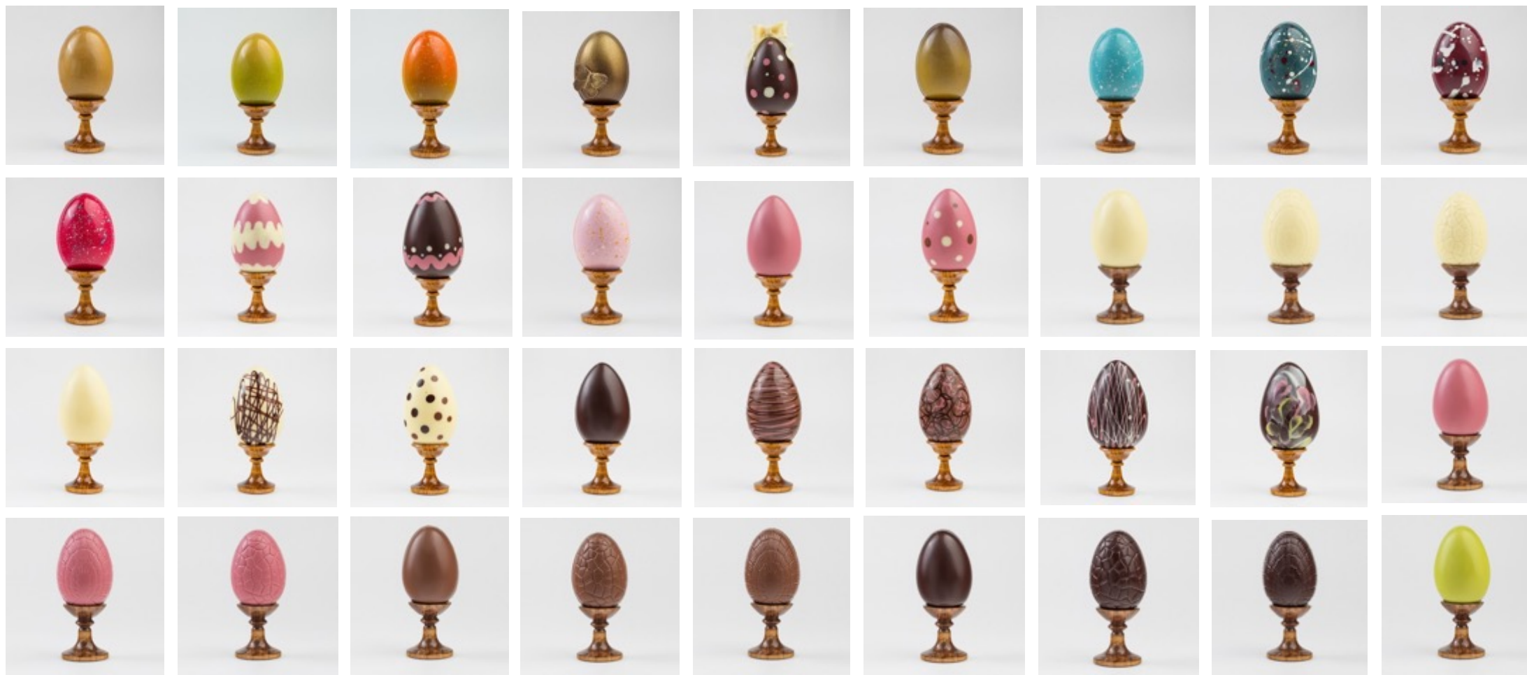
Шоколадные яйца, примеры окрашивания